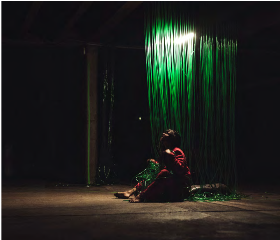
Chalon dans la rue - 2021