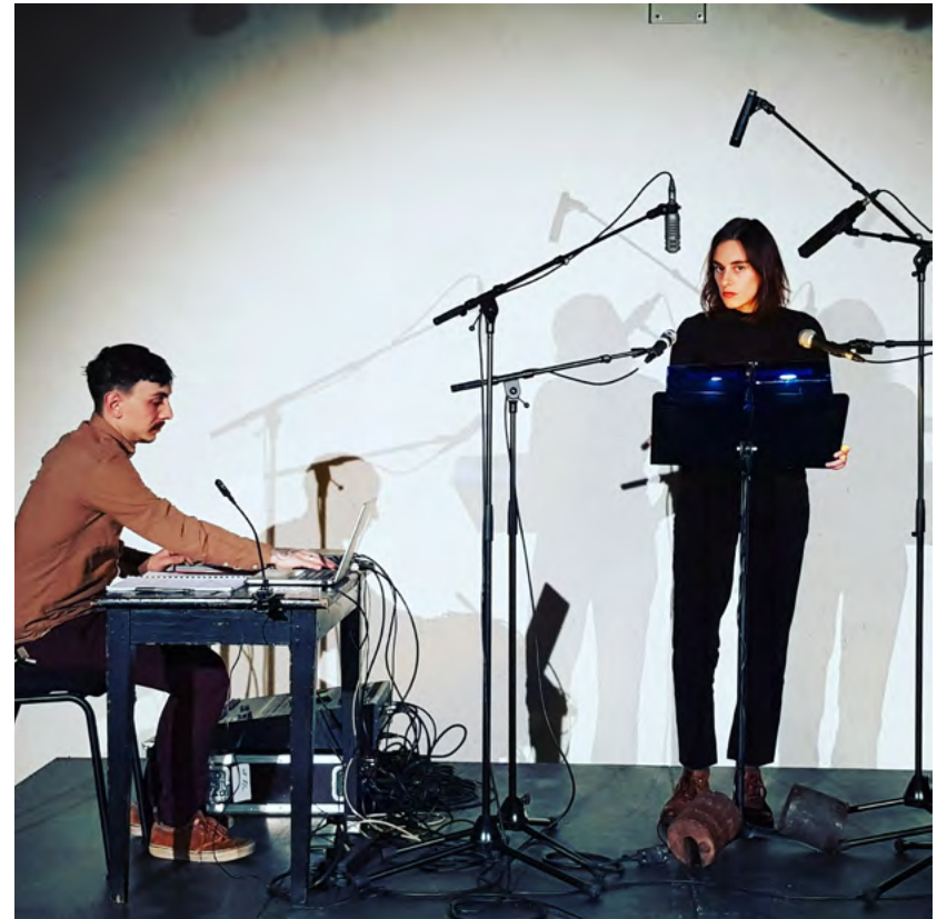
Ctrl-X lecture-performance par Pauline Peyrade