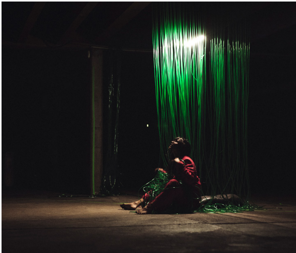
Chalon dans la rue - 2021