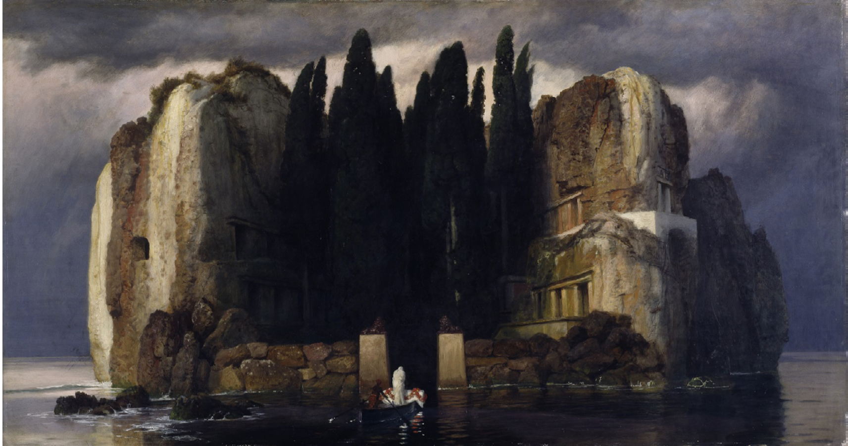
L'Île des Morts Arnold Böcklin 1880